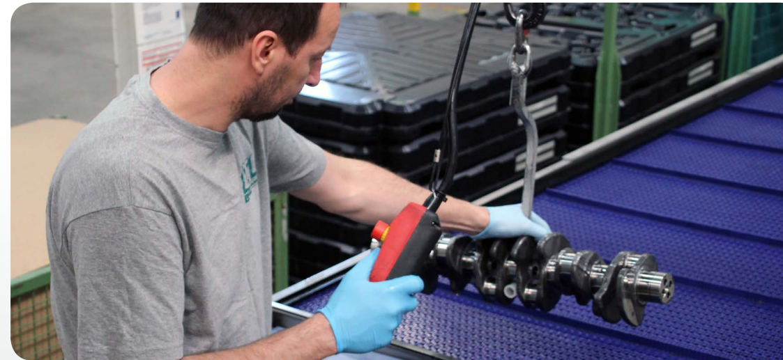
Der Korrosionsschutz bedeutet bei HTL immer die Konservierung entsprechend den Kundenwünschen.

An unserem HTL-Standort in Durlangen bieten wir neben Lagerhaltung, Montage und Entsorgungslogistik das Konservieren von Waren je nach Kundenwunsch an. Zu einem Großteil konservieren wir hier Gussteile von Motoraggregaten. Dabei setzen wir unterschiedliche Korrosionsschutzmedien ein und konservieren die kompletten Teile in einem selbst entwickelten Tauchverfahren. Der Korrosionsschutz entspricht u. a. den hohen Anforderungen der deutschen Automobilindustrie und sorgt für einen